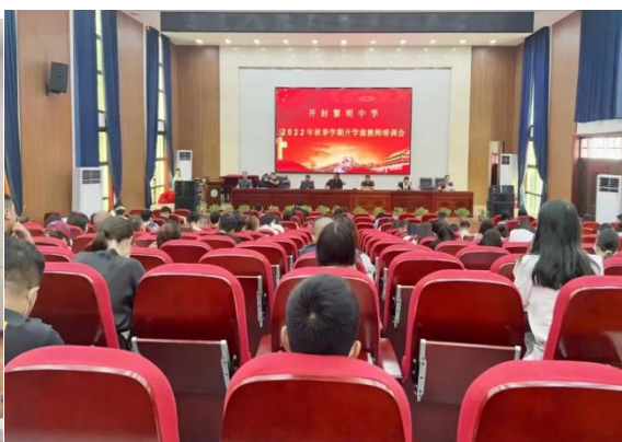
图 13 组织全体教师进行培训