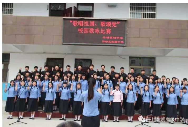
图 6 学校歌咏比赛

安全是一切校园生活的基础，是让在校学生放心学习生活，让广大家长放心学生安全的重要问题，学校非常重视校园安全问题，每天都有门卫和值班老师日夜巡视校园，24 小时随时准备应对突发状况，将危险扼杀在萌芽状态，确保全校师生的安全。