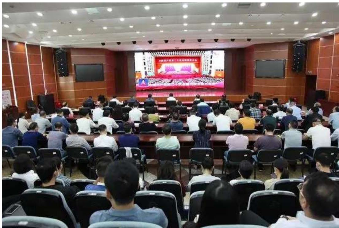
图 3 组织全体教师队伍收看二十大会议