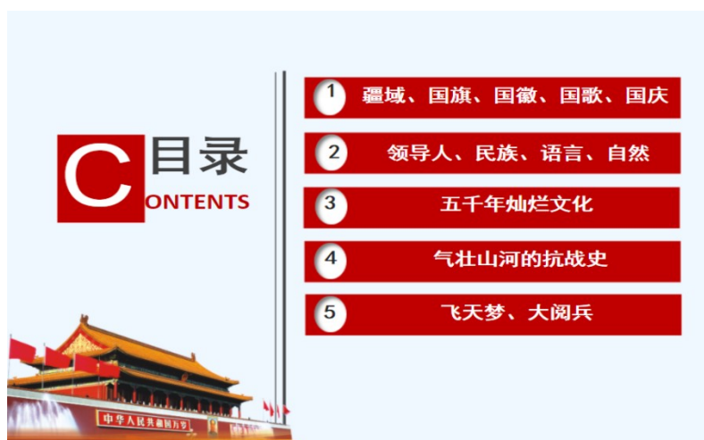
图 5 爱国主义教育主题课

学校设有学生会，下设办公室、纪检部、宣传部、卫生部、文艺部等多个部门，协助团校委进行大量工作，各部门分工协调、职责明确，成为日常学生管理工作中的主力军，为了增强团组织的凝聚力、吸引力，结合学校实际，在校领导的指导下，开展了一系列竞赛及联谊活动，同学们在活动中陶冶了情操，促进了彼此的友谊，推动了校园文明建设。