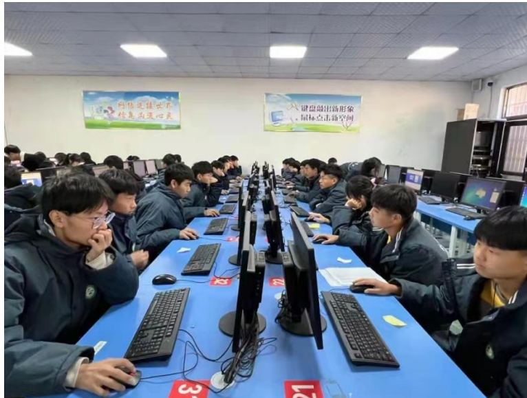
图 10 学生在计算机教室上课