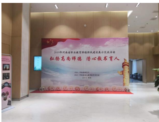
图 11 青年教师培训记录