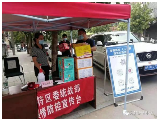
图 15 为疫情卡点提供物资帮助

时期，学院组织党员志愿者为社区居民购菜买药，保障社区居民基本需求，受到社区居民的好评。