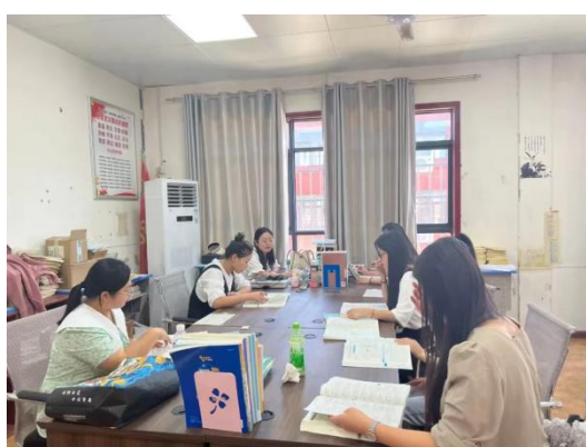
图 12 教师之间相互探讨

引进竞争机制和监督机制。以政策激励人，调动教师的主观能动性，建立定岗聘任制度及严格的考核制度，并按相应岗位级别指标进行年终考核和三年总考核，考核结果直接与岗位津贴挂钩。实行校、院两级教学督导和学生监督制度，综合评价教师课堂教学效果。逐步实行挂牌教学，促使教师在教学上下功夫，对于课堂教学优秀的教师进行大力表彰，并给予奖励。