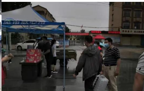
图 16 领导干部深入一线