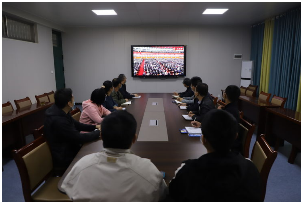
图 2 领导班子集体收看二十大，学习会议精神

工作责任制的实施办法,明确支部委员党建工作职责,推进党建工作规范化、制度化、科学化建设。