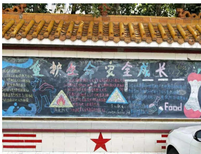
图 7 学校安全宣传板报

安全是一切校园生活的基础，是让在校学生放心学习生活，让广大家长放心学生安全的重要问题，学校非常重视校园安全问题，每天都有门卫和值班老师日夜巡视校园，24 小时随时准备应对突发状况，将危险扼杀在萌芽状态，确保全校师生的安全。