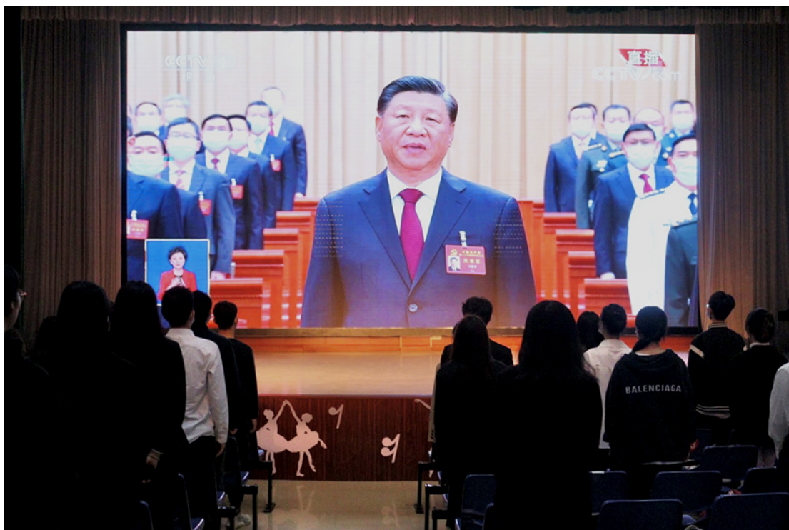
图 4 组织全体学生集体收看二十大会议