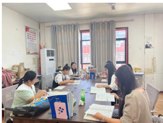
图 17 教师交流学习

积极鼓励教师参加相应的专业学习，进修相关学历课程，制定相应的奖励措施。并依据专业实际适时组织专业课教师、实习指导教师和文化基础课教师到相关高校或培训机构进行专业进修。