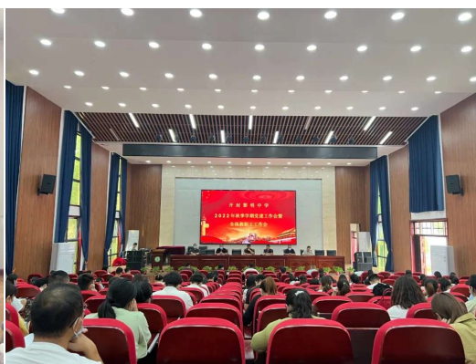
图 18 召开全体教师培训会议